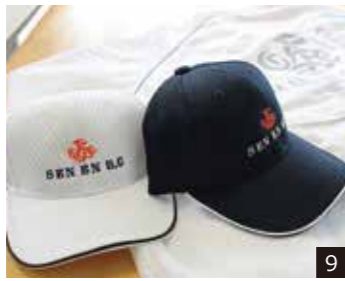
8. 昭和27年7月クラブハウスの落成式の様子。日米の関係者が集まり盛大に行われた。9. 刺繍入りメッシュキャップやロゴ入プリントジャンパーなど、オリジナルグッズも販売中。