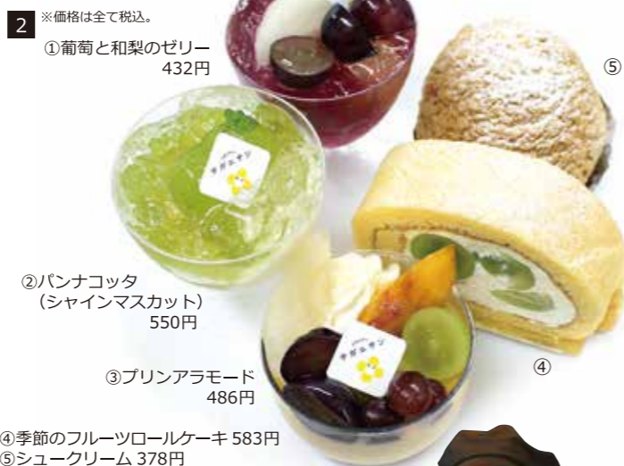
2 ※価格は全て税込。 ①葡萄と和梨のゼリー 432円 ②パンナコッタ (シャインマスカット) 550円 ③プリンアラモード 486円 ④季節のフルーツロールケーキ 583円 ⑤シュークリーム 378円