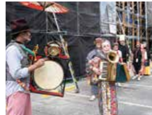
▲ 近年珍しい「ちんどんや」が登場すると拍手が沸き起こり会場は大盛り上がりとなりました。