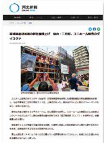
▲「河北新報」でも取り上げられました。