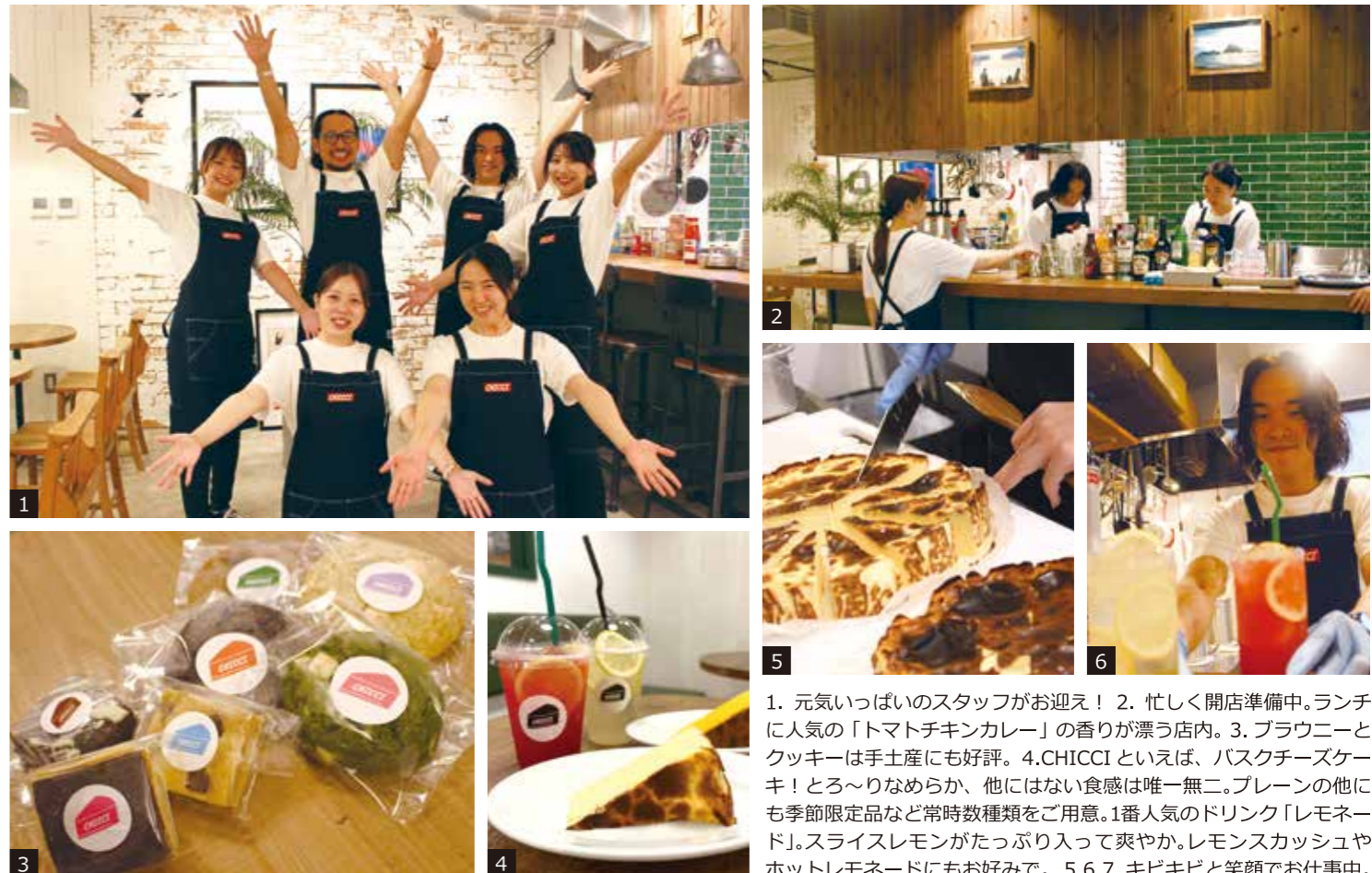
1. 元気いっぱいのスタッフがお迎え！ 2. 忙しく开店準備中。ランチに人気の「トマトチキンカレー」の香りが漂う店内。3. ブラウニーとクッキーは手土産にも好評。4. CHICCI といえば、バスクチーズケーキ！とろ〜りなめらか、他にはない食感は無二。プレーンの他にも季節限定品など常時数種類をご用意。1番人気のドリンク「レモネード」。スライスレモンがたっぷり入って爽やか。レモンスカッシュやホットレモネードにもお好みで。5.6.7. キビキビと笑顔でお仕事中。

フォロワー2万人越え、世界中のCHICCIファンが夢になり元気をもらえる動画が人気のインスタも要チェック！旅先の様子や人生相談・季節限定メニューなど盛りだくさん。みなさんも気になる催事や最新情報をチェックして、ぜひ足を運んでみてください。